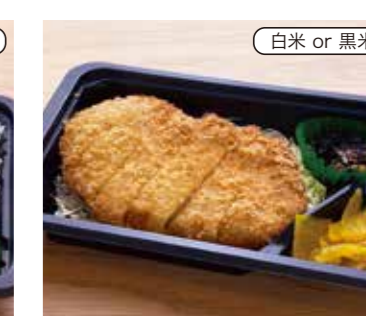
熟成ロースとんかつ弁当 税込580円 おかずのみ 480円