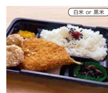
アジ&唐揚げ弁当 税込420円 おかずのみ 320円