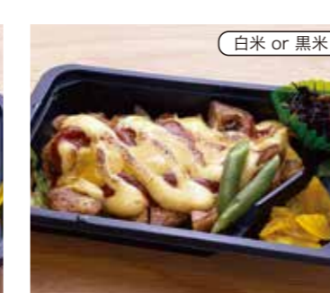
チキンステーキ弁当 税込700円 (トマトソース) おかずのみ 600円