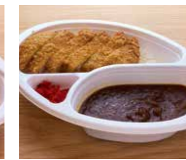
荒田ブレンド カツカレー 税込780円