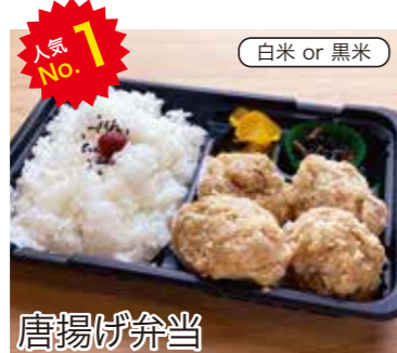
唐揚げ弁当 4個 税込380円 6個 税込500円 おかずのみ 4個 280円 6個 400円

定番、唐揚げ弁当! 当店おすすめヘルシー弁当! バラエティに富んだ 自慢のお弁当をお楽しみください!