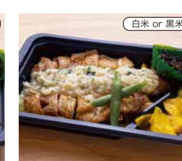
チキンステーキ弁当 税込650円 (ねぎ塩) おかずのみ 550円