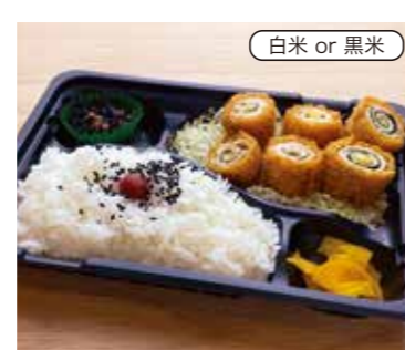
チーズチキン大葉巻き弁当 税込430円 おかずのみ 330円