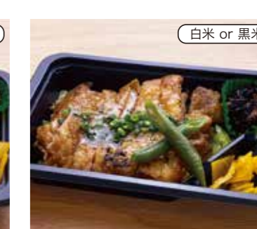
チキンステーキ弁当 税込670円 (塩) おかずのみ 570円