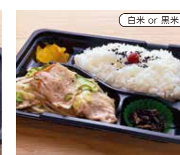
塩野菜炒め弁当 税込430円 (塩だれ) おかずのみ 330円