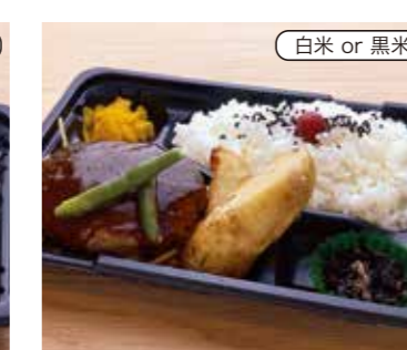
ハンバーグ弁当 税込500円 おかずのみ 400円