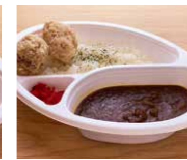
荒田ブレンド 唐揚げカレー 税込600円