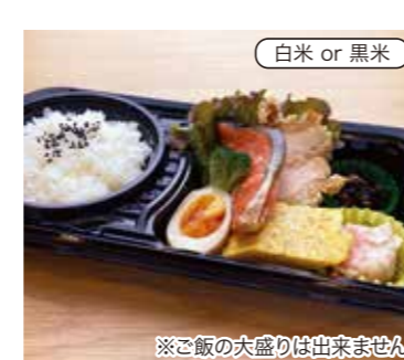
ヘルシー弁当 税込550円 ※ご飯の大盛りは出来ません