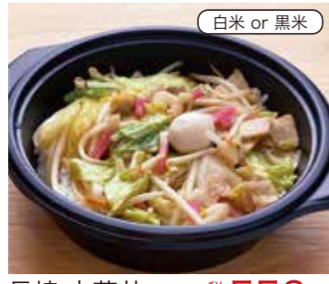
長崎 中華弁 税込550円