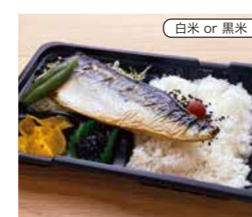
さば塩焼き弁当 税込480円 おかずのみ 380円