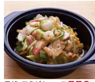
長崎 皿うどん 税込550円