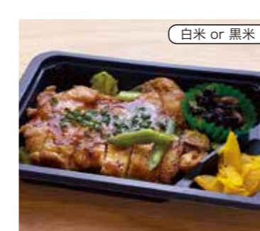
チキンステーキ弁当 税込600円 (ガーリックソース) おかずのみ 500円