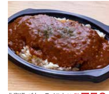
北海道 バターライスカツ 税込750円