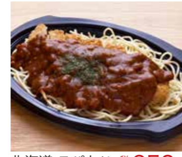
北海道 スパカツ 税込650円