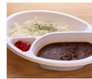
荒田ブレンド ビーフカレー 税込530円