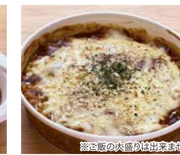
くるだるま特製 オープンカレー 税込550円 ※ご飯の大盛りは出来ません