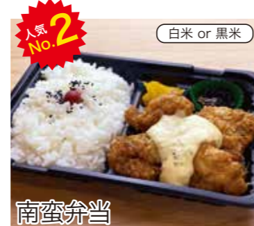
南蛮弁当 4個 税込470円 6個 税込570円 おかずのみ 4個 370円 6個 470円