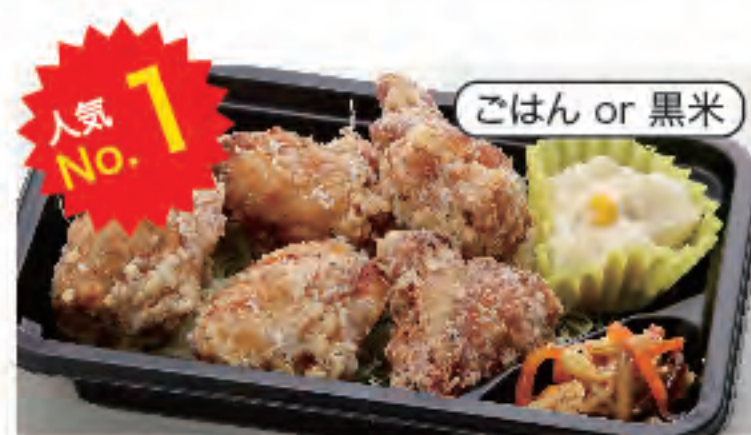
人気 No.1 唐揚げ弁当(6個) 税込 500円 おかずのみ 400円