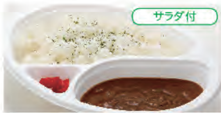
サラダ付 ビーフカレー 税込 500円