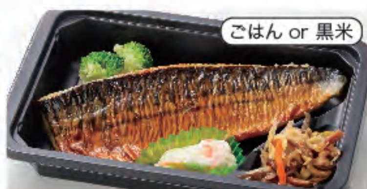
ごはん or 黒米 さば塩焼き弁当 税込 480円 おかずのみ 380円