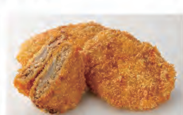
メンチカツ 1個 180円 (税込)