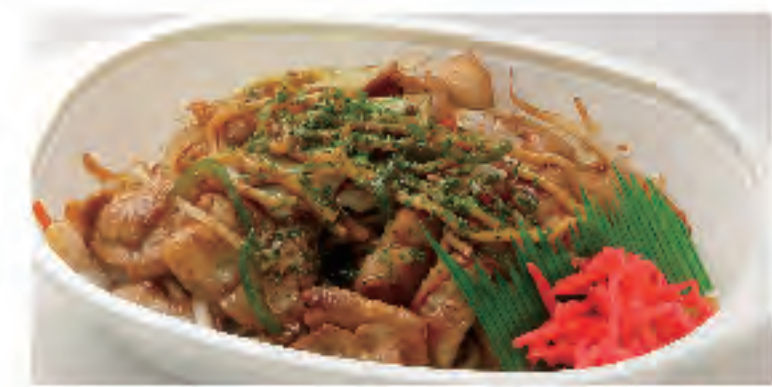
やきそば 税込 390円