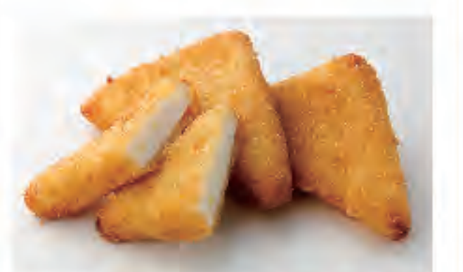
白身フライ 1個 110円 (税込)