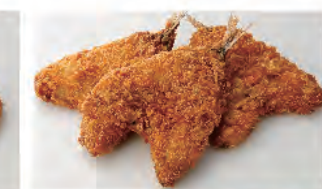
ハムカツ 1個 170円 (税込)