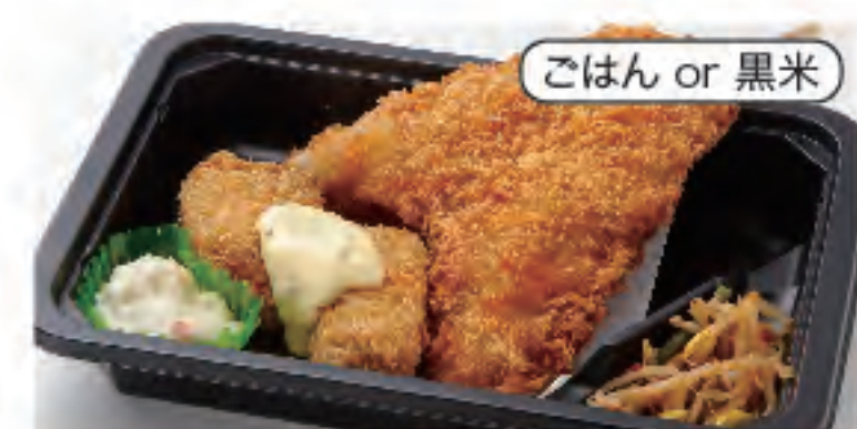
ごはん or 黒米 アジ&カキフライ弁当 税込 600円 おかずのみ 500円