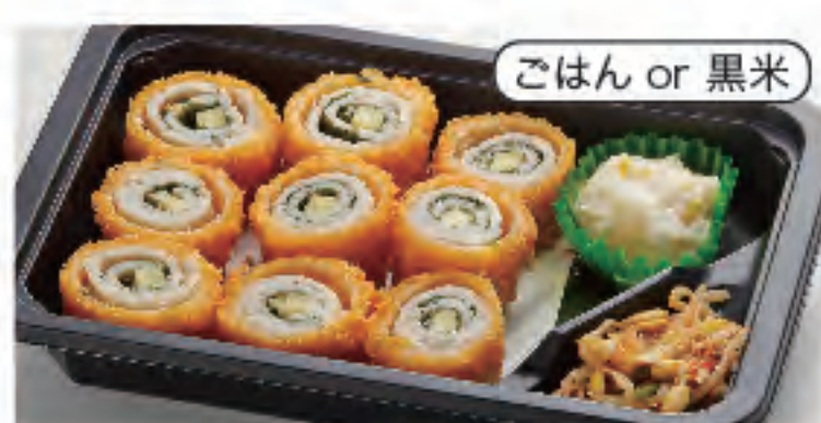
ごはん or 黒米 チーズチキン大葉巻き弁当 税込 500円 おかずのみ 400円