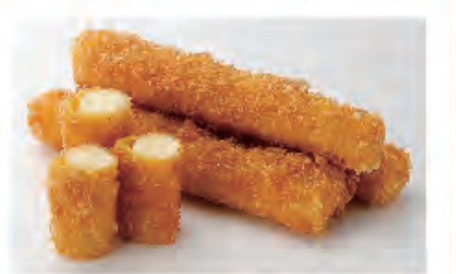
チーズ一本揚げ 1個 220円 (税込)