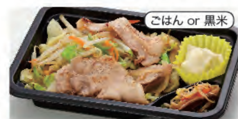
ごはん or 黒米 塩野菜炒め弁当(塩だれ) 税込 500円 おかずのみ 400円