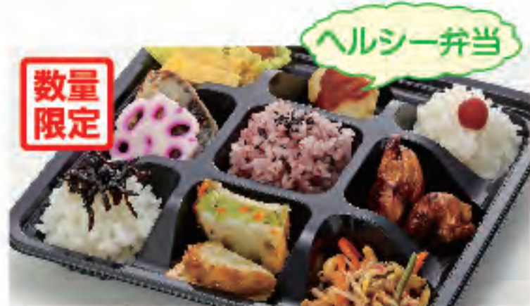
数量限定 あおい 税込 490円