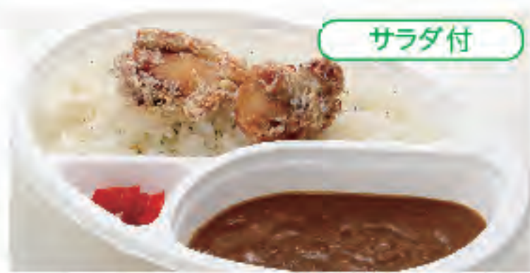
サラダ付 唐揚げカレー 税込 550円