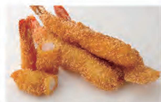
イカフライ 1個 200円 (税込)