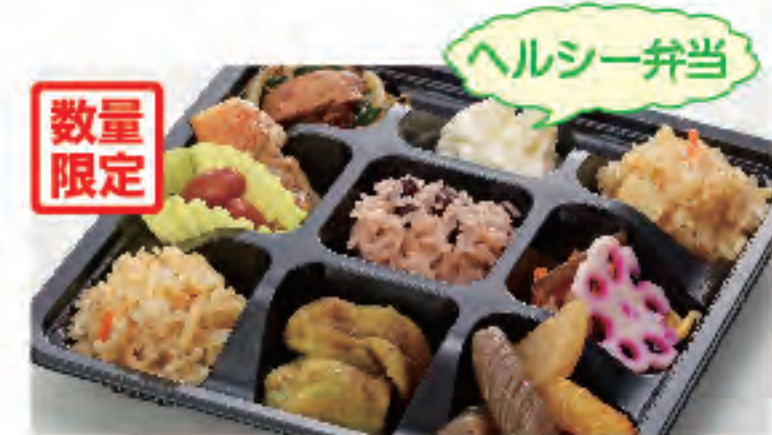
数量限定 小町 税込 590円

くろだるま定番、唐揚げ弁当! 当店おすすめヘルシー弁当! その他、バラエティに富んだ自慢のお弁当をお楽しみください!