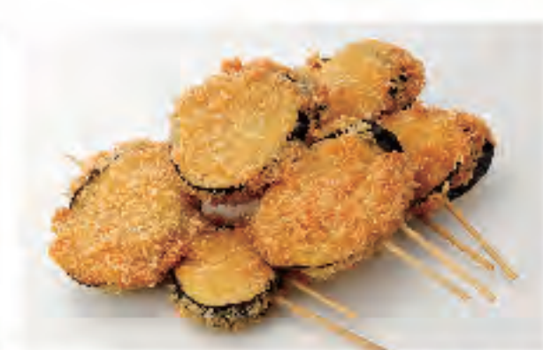
ナスフライ 1個 120円 (税込)