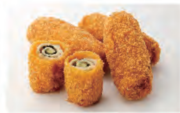
チーズチキン大葉巻き 1個 130円 (税込)