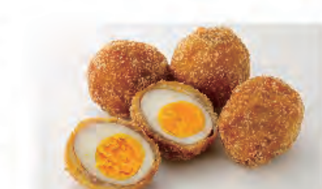
煮玉子フライ 1個 130円 (税込)