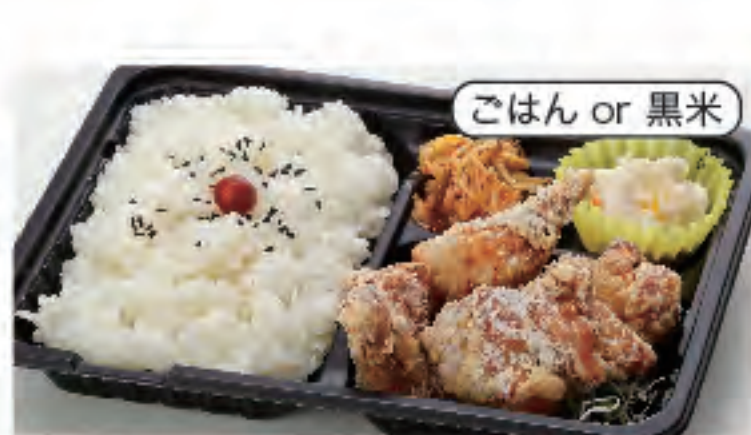
ごはん or 黒米 唐揚げ弁当(4個) 税込 380円 おかずのみ 280円