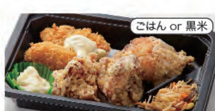
ごはん or 黒米 カキ&唐揚げ弁当 税込 420円 おかずのみ 320円