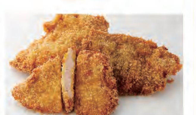
チキンカツ 1個 160円 (税込)