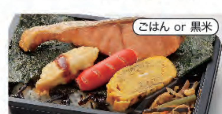
ごはん or 黒米 のりシヤケ弁当 税込 480円