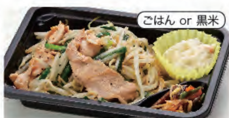
ごはん or 黒米 塩もやし炒め弁当 税込 400円 おかずのみ 300円