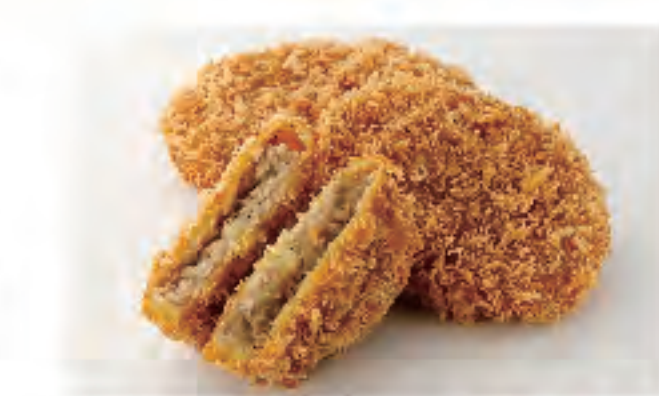
黒豚コロッケ 1個 130円 (税込)