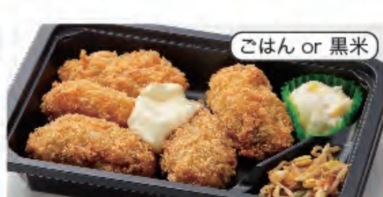
ごはん or 黒米 カキフライ弁当 税込 680円 おかずのみ 580円