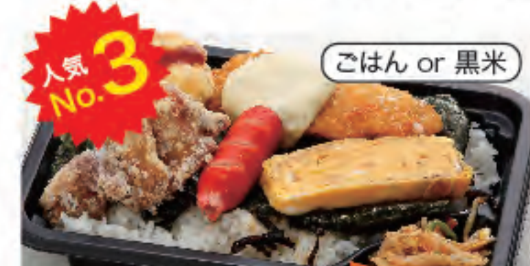
人気 No.3 のり弁当(唐揚げ) 税込 390円