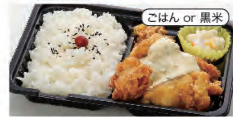
ごはん or 黒米 南蛮弁当(4個) 税込 470円 おかずのみ 370円