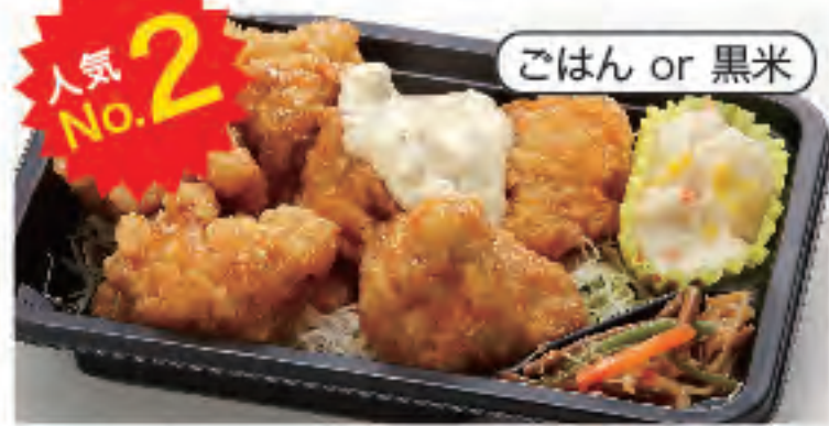
人気 No.2 南蛮弁当(6個) 税込 570円 おかずのみ 470円