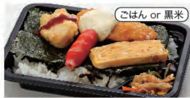
ごはん or 黒米 のり弁当 税込 360円