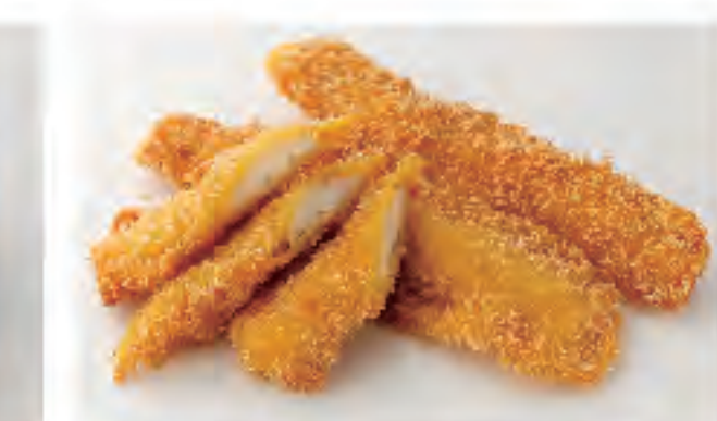
肉じゃがコロッケ 1個 90円 (税込)