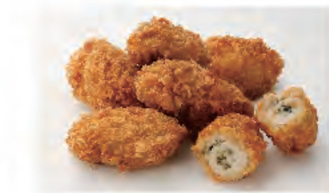
カキフライ 1個 110円 (税込)