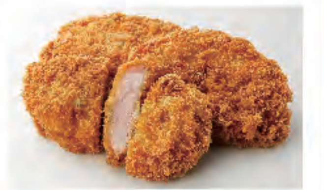
トンカツ 1個 400円 (税込)