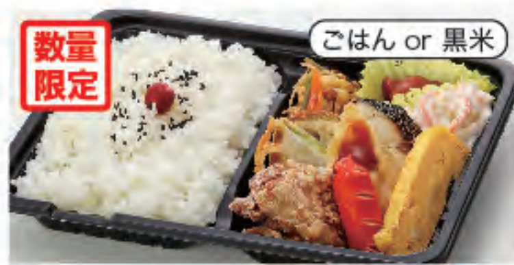
数量限定 幕の内弁当 税込 460円