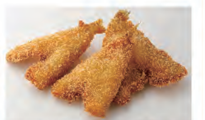
エビフライ 1個 240円 (税込)