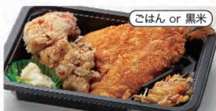
ごはん or 黒米 アジ&唐揚げ弁当 税込 420円 おかずのみ 320円