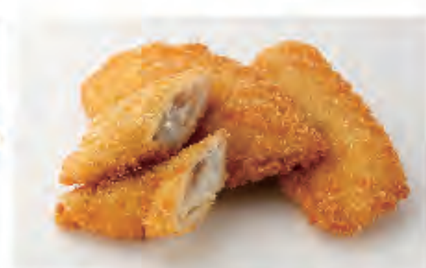
アジフライ 1個 250円 (税込)