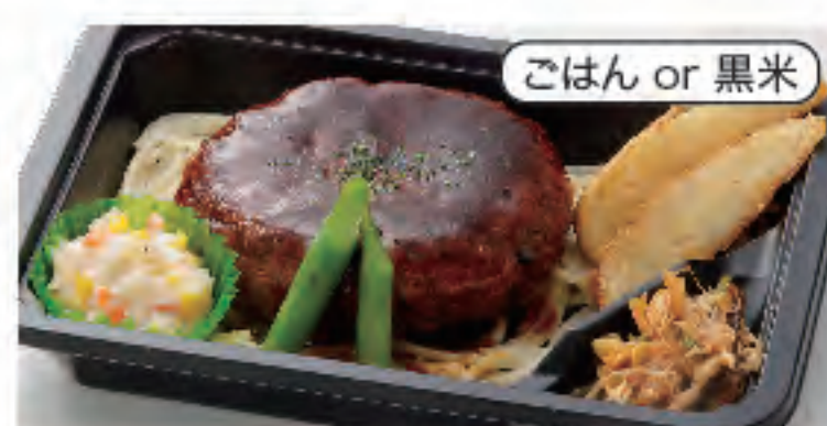
ごはん or 黒米 ハンバーグ弁当 税込 500円 おかずのみ 400円