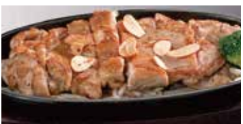
チキンステーキ(塩) 470円