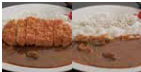
カツカレー 770円 ビーフカレー 600円