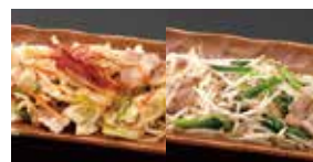
野菜炒め 370円 塩もやし炒め 350円