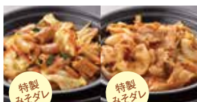
ホルモン 600円 豚みそ炒め 600円