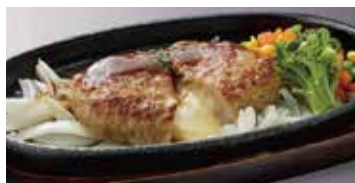
チーズインハンバーグ 630円