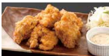
南蛮(並)6個 570円 (小)4個 470円