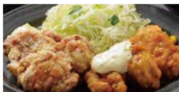
唐揚げ & 南蛮 540円