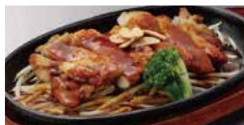
チキンステーキ(ガーリック) 470円