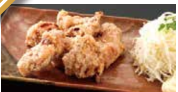
唐揚げ(並)6個 440円 (小)4個 340円