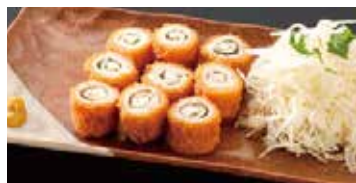
チーズチキン大葉巻(並) 470円 (小)420円