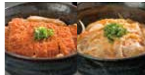
カツ丼 600円 玉子丼 410円