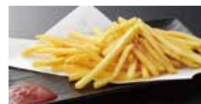
スティックポテト 280円