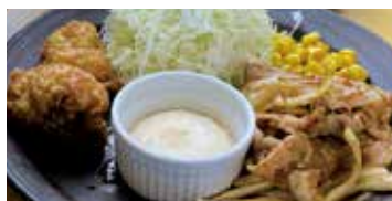
生姜焼き & 南蛮 540円