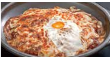
オープンカレー 550円