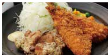
唐揚げ & アジフライ 530円