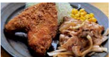
生姜焼き & アジフライ 540円