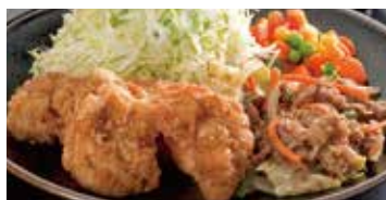
黒(チキン南蛮 & 焼肉) 650円