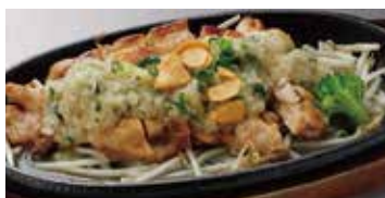
チキンステーキ(ねぎ塩) 470円