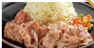
だるま(唐揚げ & 生姜焼き) 590円