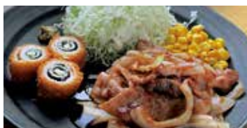
生姜焼き & チーズチキン 540円