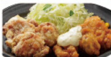
唐揚げ & 南蛮 520円