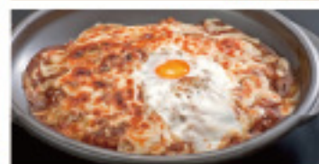
オープンカレー 550円