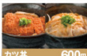
カツ丼 600円 玉子丼 410円