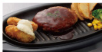
ハンバーグ & カキフライ 730円