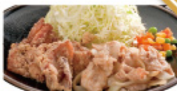
だるま(唐揚げ & 生姜焼き) 570円