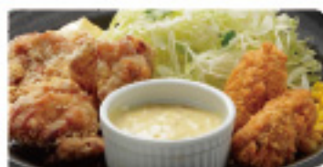
唐揚げ & カキフライ 570円