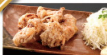
唐揚げ(並)6個 420円 (小)4個 320円