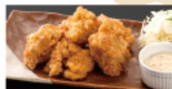
南蛮(並)6個 550円 (小)4個 450円