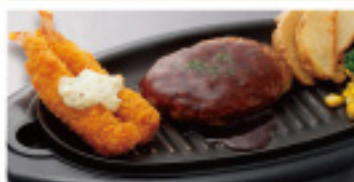
ハンバーグ & エビフライ 730円