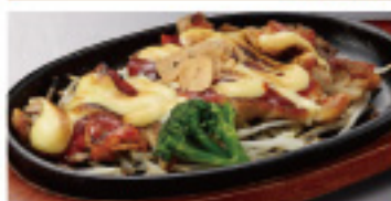
チキンステーキ(ピリ辛チーズ) 520円