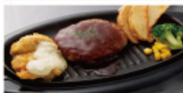
ハンバーグ & 南蛮 730円