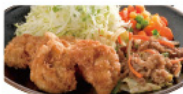
黒(チキン南蛮 & 焼肉) 630円