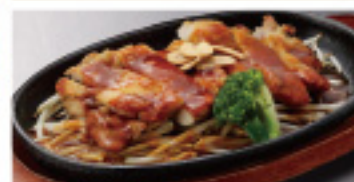
チキンステーキ(ガーリック) 470円