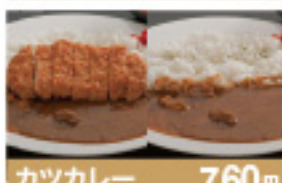
カツカレー 760円 ビーフカレー 600円