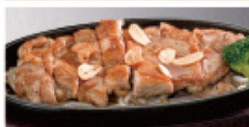
チキンステーキ(塩) 470円