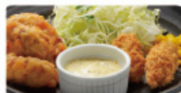
南蛮 & カキフライ 550円