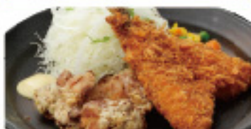
唐揚げ & アジフライ 510円