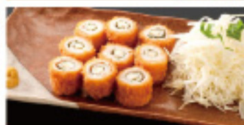
チーズチキン大葉巻(並) 460円 (小)410円