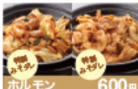
ホルモン 600円 豚みそ炒め 600円