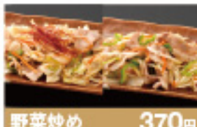
野菜炒め 370円 塩野菜炒め 400円